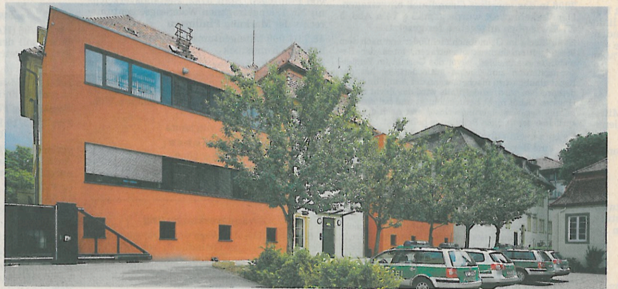
Die Rückansicht des Cottabaus ziert nun ein Neubau. Im Gesamtkomplex ist das Polizeirevier untergebracht.